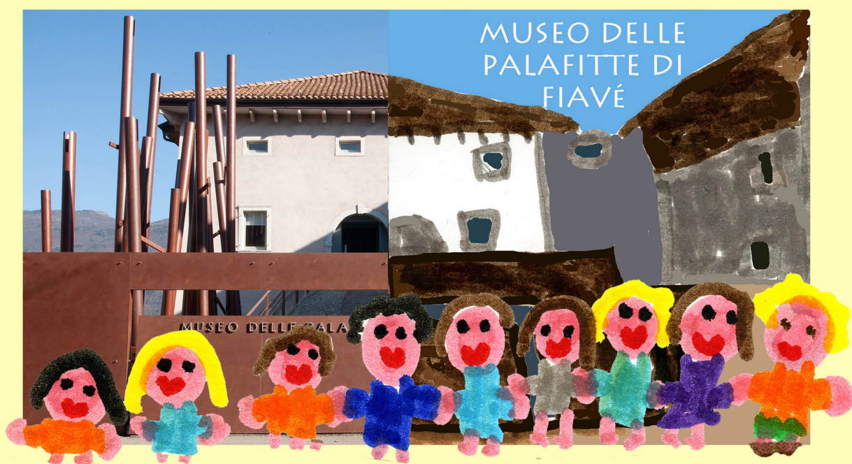
ГРАДИНКА "МАРИА ВАЛЕНТИНИ" ФИАВЕ - ТРЕНТО